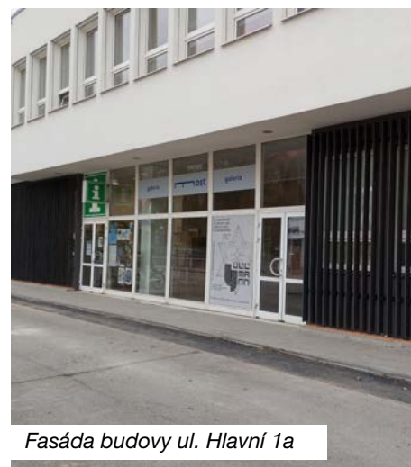
Fasáda budovy ul. Hlavní 1a