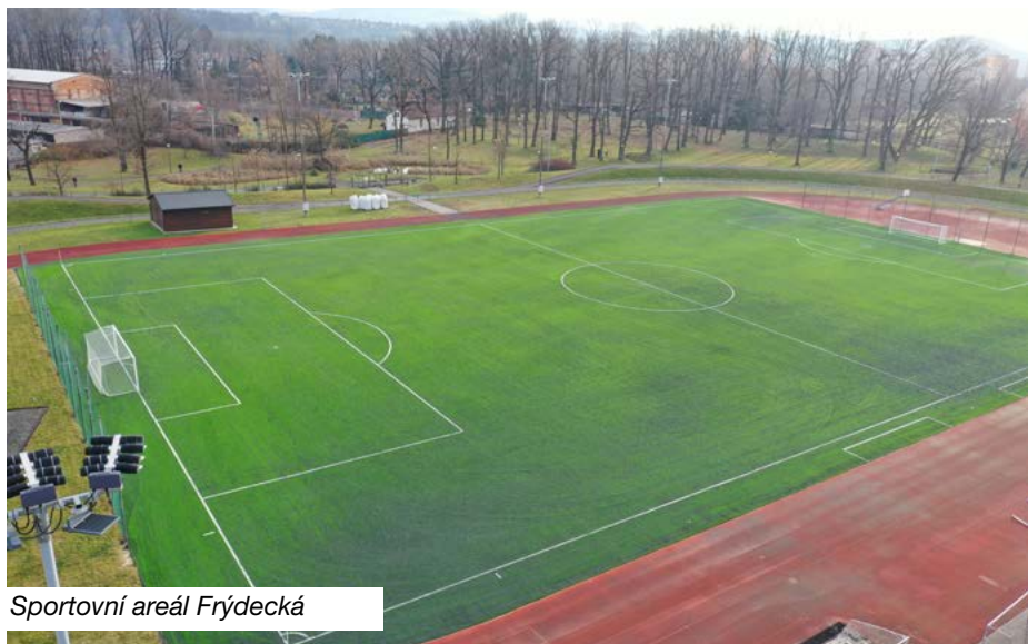
Sportovní areál Frýdecká

Z rozpočtu města byly financovány v roce 2024 další pro město významné akce. Interiér kulturní památky hřbitovní kaple na centrálním