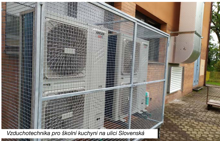
Vzduchotechnika pro školní kuchyni na ulici Slovenská