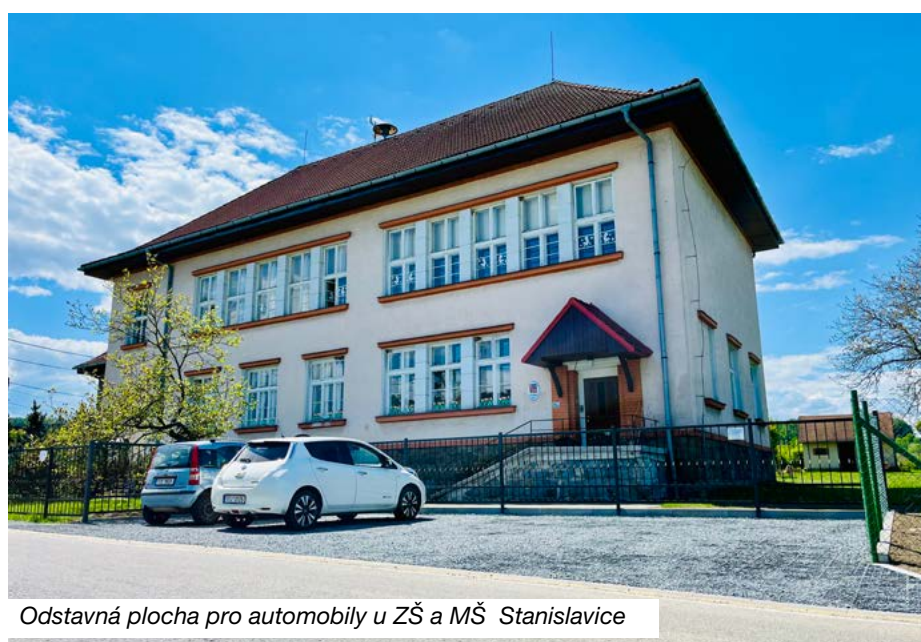
Odstavná plocha pro automobily u ZŠ a MŠ Stanislavice