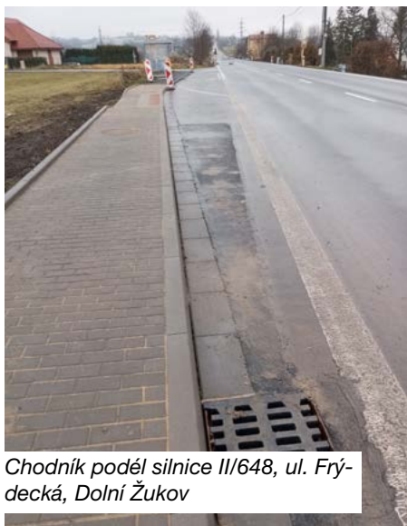
Chodník podél silnice III/648, ul. Frýdecká, Dolní Žukov

Akcí realizovaných s dotační podporou v loňském roce bylo hned několik. Pro občany jistě nejatraktivnější novinkou byla instalace plovoucího mola na vodní nádrži Hrabina v rámci započaté revitalizace těšínské přehrady. Zvýšení bezpečnosti chodců zajistil v Dolním Žukově u zastávky Blahut zcela nově vybudovaný chodník, který tam občané této městské části léta postrádali.