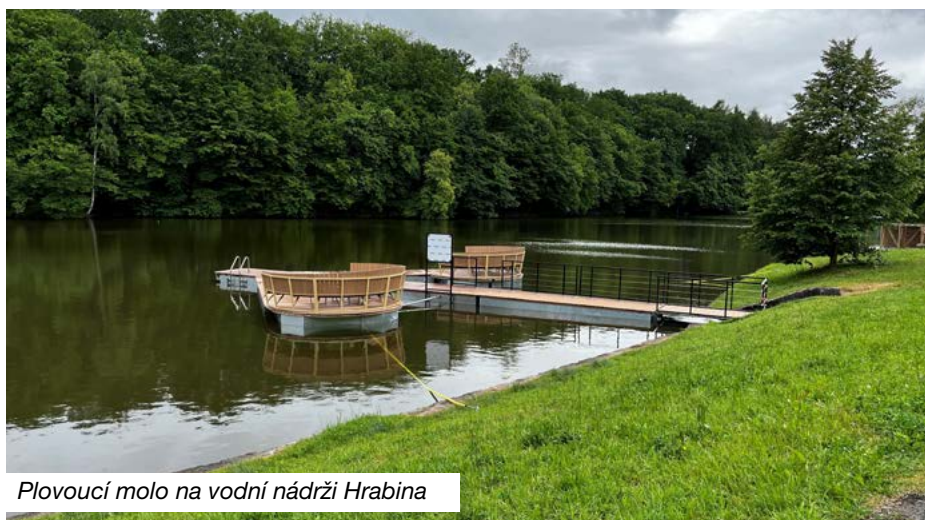
Plovoucí molo na vodní nádrži Hrabina