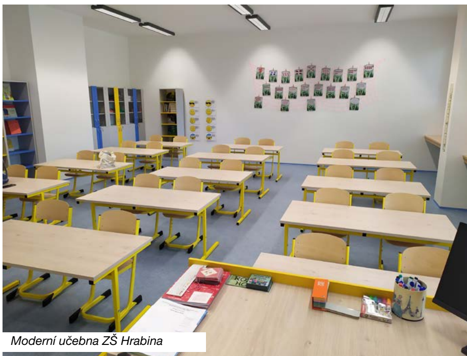
Moderní učebna ZŠ Hrabina

„Investice do škol považuji za významnou prioritu“ říká starosta města Karel Kula a pokračuje: „V dětech a mládeži je naše budoucnost, a proto bychom jim měli věnovat maximální pozornost. Jsem rád, že toto předsevzetí se daří plnit a nastolený cíl města vůči zřizovaným školám vnímají pozitivně i samotní ředitelé. Již třetím rokem obdrží každý z nich pro