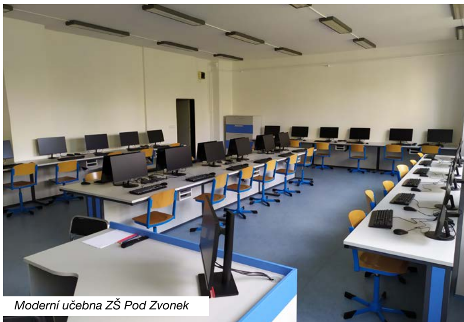
Moderní učebna ZŠ Pod Zvonek

Dalšími realizovanými dotačními projekty byly z Programu regenerace městských památkových rezervací a městských památkových zón objekty dvou mateřských škol v městské památkové zóně, kde město opravilo střechu na tzv. Fuldově vile, ve které sídlí MŠ v Masarykových sadech, a rovněž vnitřní schodiště v MŠ na ul. Smetanova.