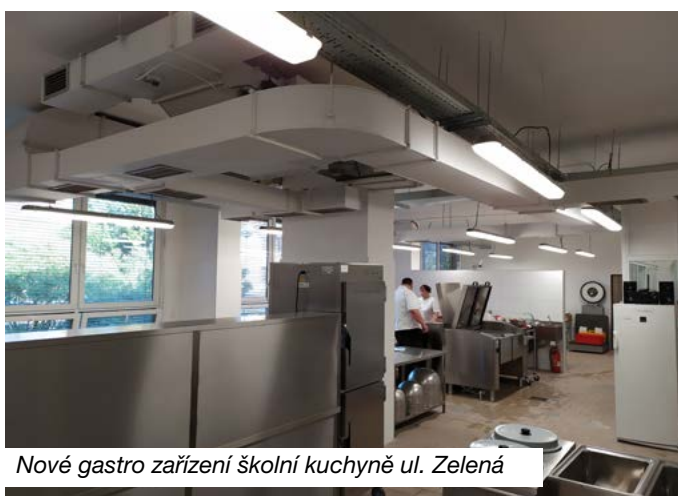
Nové gastro zařízení školní kuchyně ul. Zelená