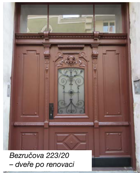
Bezručova 223/20 – dveře po renovaci