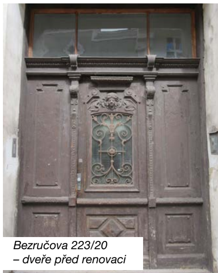
Bezručova 223/20 – dveře před renovací

Miroslav Morawiec odbor územního rozvoje