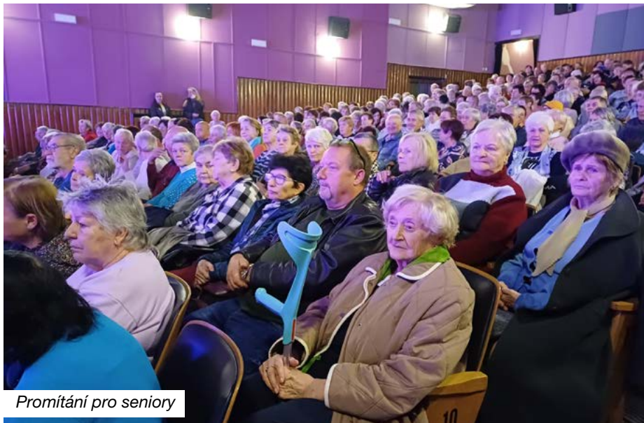
Promítání pro seniory

Program AKROPOL zastřešuje aktivity pro seniory, je finančně podporován městem. Členem klubu se může stát každý občan Českého Těšína seniorského věku. Více na www.knihovnatesin.cz .