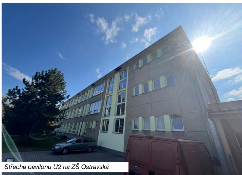
Střecha pavilonu U2 na ZŠ Ostravská