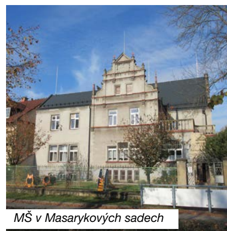
MŠ v Masarykových sadech

■ Projekt „ZŠ Kontešinec Oprava střechy MŠ Masarykovy sady“ podpořený dotací ve výši 872 tisíc Kč. Tady došlo k sanaci krovu a kompletní opravě střešních konstrukcí – kompletní výměně plechové střešní krytiny za skládanou krytinu z plechových šablon v hlavních plochách střech, za falcovanou plechovou krytinu na kopuli věžičky a pod nástřešními