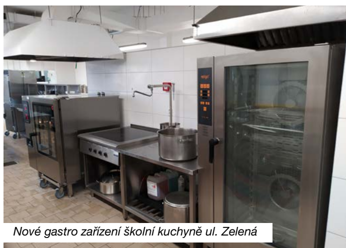
Nové gastro zařízení školní kuchyně ul. Zelená

Z rozpočtu města se pak rekonstruovala rovněž střecha v Pavilonu U2 na ZŠ na ul. Ostravská. U ZŠ ve Stanislavicích město vybuodovalo odstavnou plochu pro 5 automobilů, které slouží zejména pro bezpečnější nástupy či výstupy žáků. Postupně se na školách modernizuje i sociální zařízení. Rekonstrukcí prošly částečně toalety na ZŠ na ul. Havlíčkova a v suterénu u hřiště u Masarykovy ZŠ na ul. Komenského, které ocení určitě sportovci.