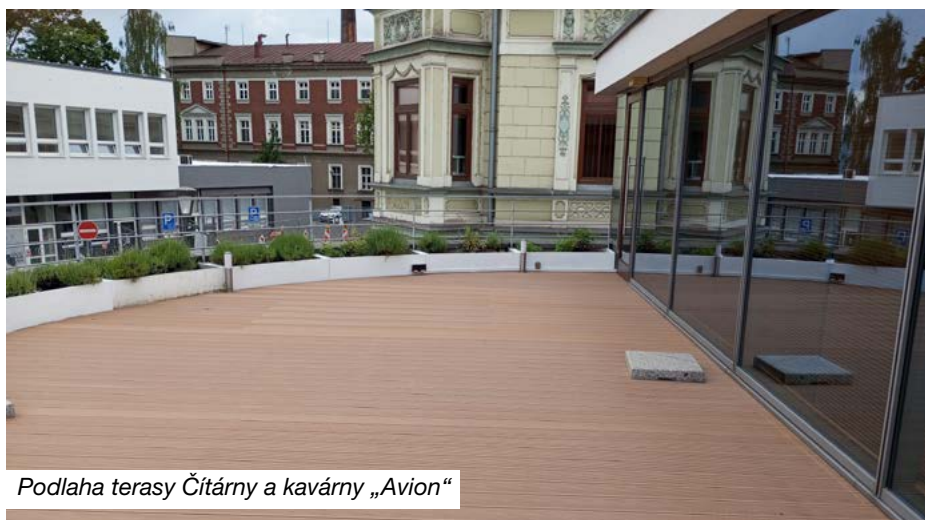
Podlaha terasy Čítárny a kavárny „Avion“