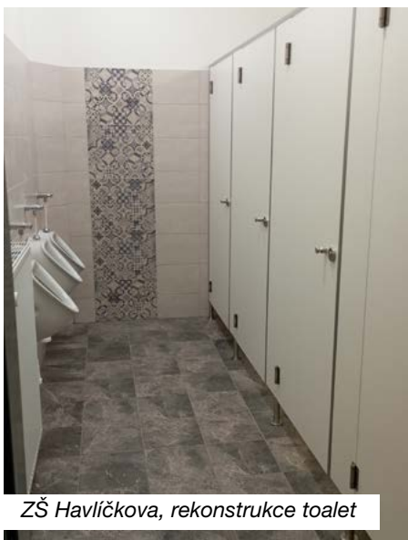
ZŠ Havlíčkova, rekonstrukce toalet