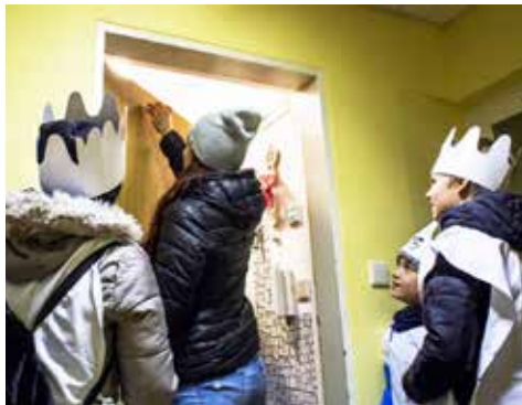
Vloni vybrali koledníci v Rychvaldě 62 900 Kč

Aktuální informace o průběhu sbírky můžete sledovat na we-