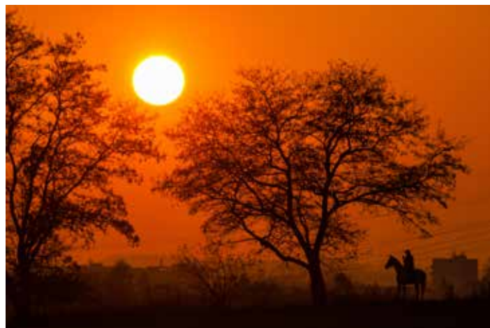
"Tahle fotka se mi v kalendáři líbí asi nejvíce," říká Pavel Piša.