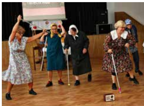
„Babky“ z Kmitu Orlová to pěkně rozjely