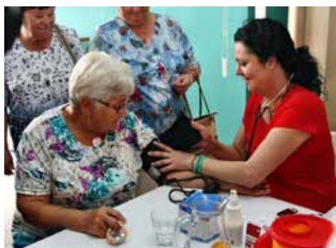
Sestry měřily tlak a hladinu cukru v krvi