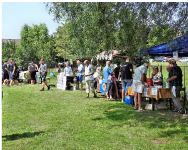
Degustace a hodnocení gulášů spuštěno