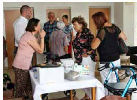
Hlavní partner akce radil také na stánku