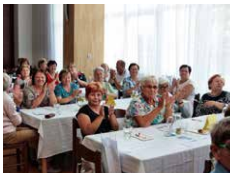
Kdo z nich nechyběl u všech Seniordnů?