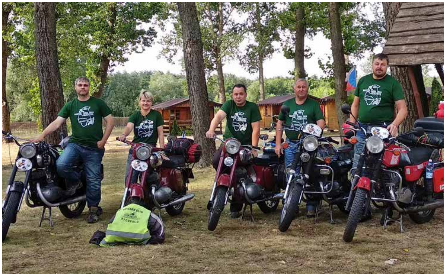
Na mezinárodním setkání JAWA BALTIC 2019 reprezentovalo naše město pět členů Veterán klubu Rychvald se svými krásnými stroji