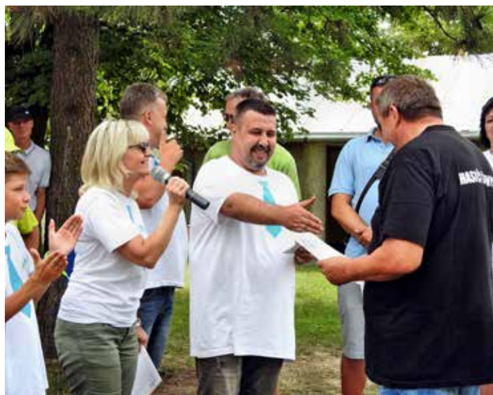
Ocenění za nejlepší guláš si odnesli šunychelští hasiči