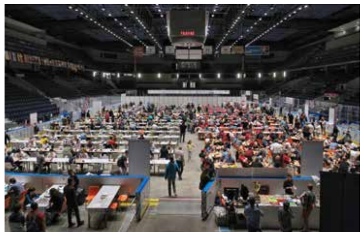
Pohled do haly, kde se Mistrovství ČR odehrává

V neděli už na nás začala doléhat únava z náročného programu, ale našťastí mladíci náš tým podrželi. Dopoledne bojujeme se silným týmem z Poličky a díky výhrám dvou našich mladíků slavíme nečekanou