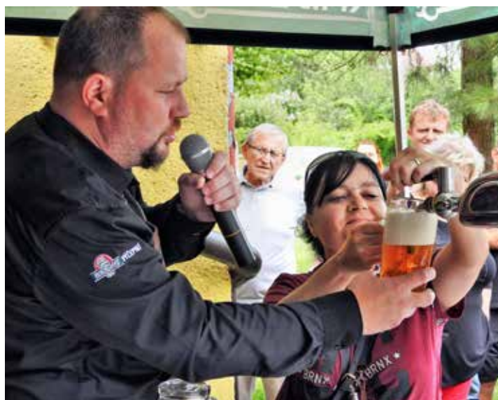
Škola čepování piva zaujala