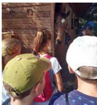
Koňů jsme se nebáli...