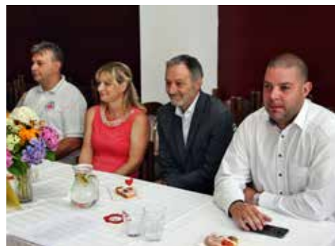
Setkání hostů a přednášejících u stolu