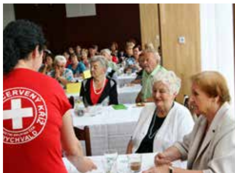
Zahájení Seniordne 2019 bude už za chvíli

V. Krzyžanková, MS ČČK