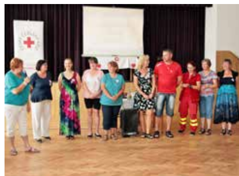
Díky všem, kdo pečovali o pohodu účastníků