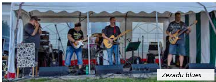
Ze zadu blues