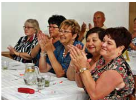
Někdy bylo vážně, jindy hodně veselo