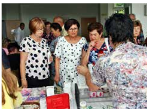
Vyzkoušíme toto, nebo snad něco jiného?