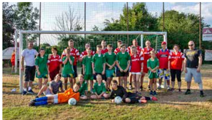
Exhibiční zápas proti rodičům si zahráli benjamínci (vlevo) i jejich starší kamarádi. Hrál se sice na góly, ale výsledky tentokrát nebyly důležité...