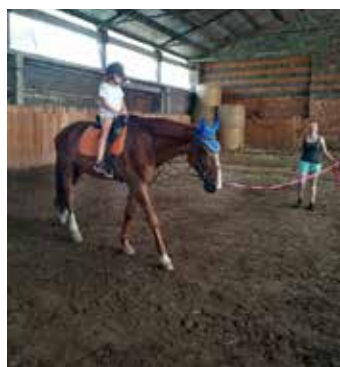
Někteří se i projeli