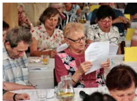
Texty připomněly zapomenutá slova písničky