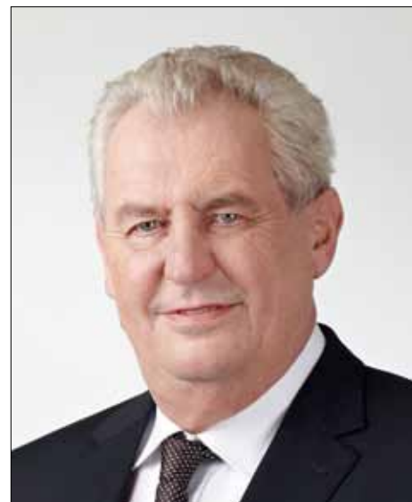
Nový prezident ČR Miloš Zeman