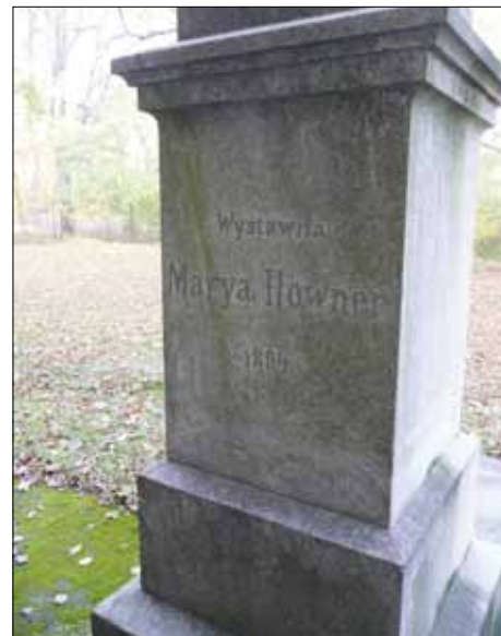
(Nápis na fotografii byl kvůli špatné čitelnosti pro účely publikace graficky zvýrazněn.)