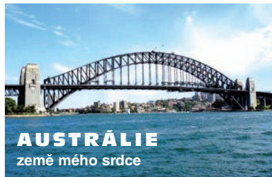
AUSTRÁLIE země mého srdce

RNDr. Jaroslav Suchánek byl velvyslan- cem České republiky v Austrálii a na Novém Zélandu v letech 1993-1998. Ve své oficiální funkci i během pozděj- ších pobytů měl možnost poznat velkou část této země-kontinentu, do které se každoročně vrací. Vstupné dospělí 40 Kč, studenti 20 Kč