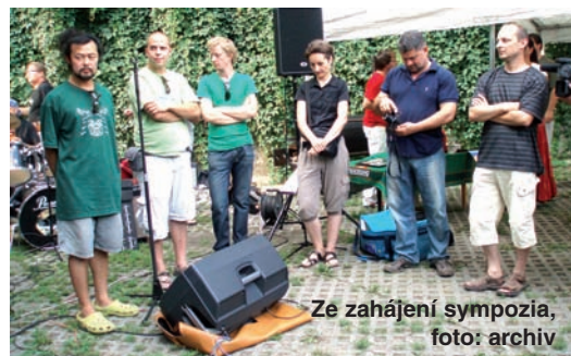
Ze zahájení symposií

Na symposium musí organizátor navést vždy asi 65 tun kamene, což je pěkná porce. Každý si již vybral