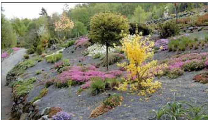
Pohled do arboreta NA HRAD Sovinec z výšky