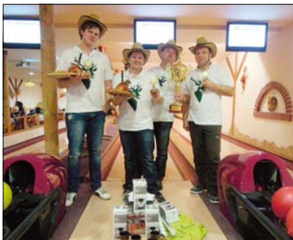
Vítězové – bowling

Již potřetí se sešli v neděli 31. března 2013 všichni nadšenci bowlingu ze širokého okolí v restauraci a bowlingu Selský dvůr na turnaji „O pohár starosty obce“. Soutěže se zúčastnilo 11 čtyřčlenných družstev, která v tříkolovém maratónu předváděla své dovednosti a nikomu nevadilo, že venku zuří spíše vánoční vánice. Letos poprvé byla vložena do turnaje i soutěž v šípkách a tak se po celý den skutečně nikdo nenudil. Velké poděkování patří všem zaměstnancům Selského dvora, kteří připravili výborné jídlo, dostatek tekutin i dalších pochutin. Musím říci, že se všichni zúčastnění snad již nyní těší na příští ročník.