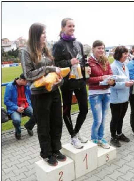
Vítězové kondičního běhu