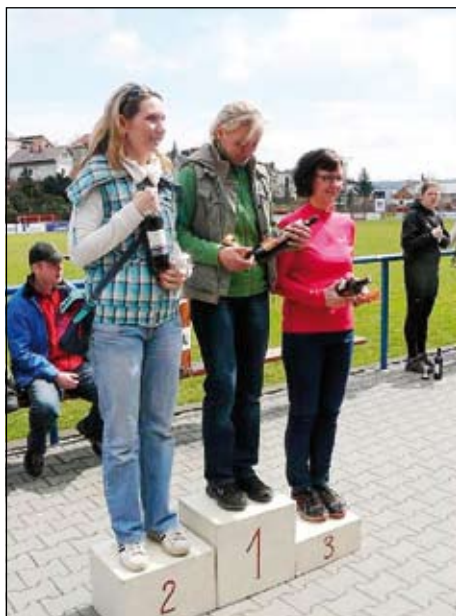
Vítězky kategorií ženy do 34 let a ženy nad 35 let