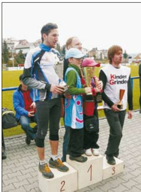
Vítězné kategorie mužů do 49 let a mužů do 39 let