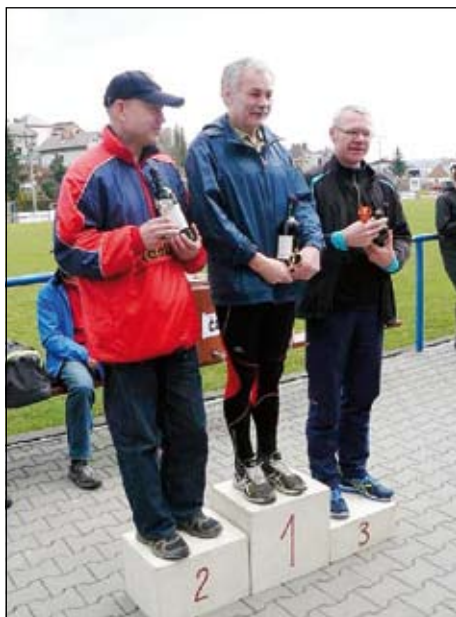
Vítězné kategorie mužů nad 60 let a mužů do 59 let