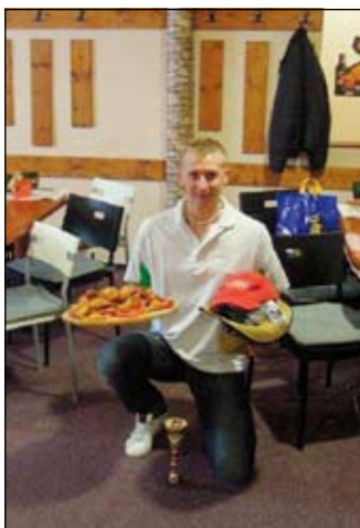
Vítěz – šípky