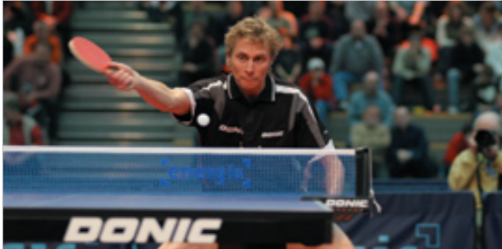
Jörgen Persson (narozen 22. 4. 1966 v Halmstadu), mistr světa ve dvouhře, mistr Evropy ve dvouhře, čtyřnásobný mistr světa v družstvech, vicemistr světa ve dvouhře, vítěz turnaje TOP 12, čtyřnásobný Mistr Evropy v družstvech, 4. místo na olympijském turnaji ve dvouhře v letech 2000 a 2008, mistr Evropy ve čtyřhře.