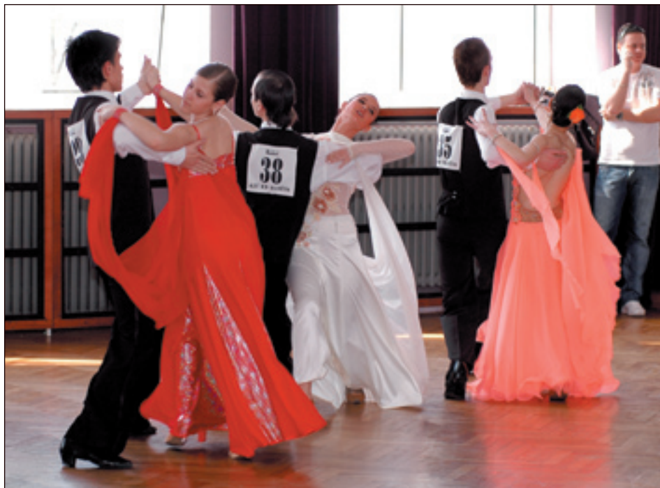
Argentinské tango je tanec vášnivý a důrazný. Je důležité pevně držet partnera i linie vlastního těla. S touto podmínkou pak zvládnete i prudké základy, aniž byste skončili na podlaze.

Přes tři stovky tanečníků se sjely první aprílový víkend do Hlučína. Ne však proto, aby si zde dělali ze sebe navzájem legraci. Přílákala je již tradiční soutěžní přehlídka tanečního umění Hlučínská lilie. V našem městě se konala již po pětadvacáté. Běžně přijíždí na hlučínskou taneční soutěž obsada nejen z tuzemska, ale i zahraničí. Nejinak tomu bylo i tento rok, i když se zahraniční účastníci rekrutovali výhradně od našich východních sousedů. Zato jich však byla polovička. Novinkou letošní Lilie byla nová