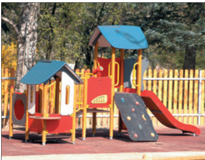
Pestrobarevné prolézačky za kulturním domem čekají na své první návštěvníky.

Hned dvě slavnostní přestřižení pásky čekají hlučinského starostu v měsíci květnu. Jako první se otevření dočká Klidová zóna v blízkosti kulturního domu, na kterou jedním a půl milionem korun přispěla Nadace ČEZ. Její zástupci spolu s představiteli města Hlučína předají 5. května v 10 hod. nové hřiště k užívání především místním dětem. Na zelení osázené ploše o rozloze cca 1300 m 2 na ně čeká celá řada hracích a sportovních prvků. Výstavba Klidové zóny stála téměř 4,8 miliónů korun. Jejím zhotovitelem byla firma ALL&ING, s.r.o. Kromě již zmíněné dotace byla finančně pokryta z rozpočtu města. (Id)