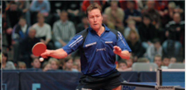
Jan Ove Waldner (narozen 3. 10. 1965 ve Stockholmu), olympijský vítěz ve dvouhře, dvojnásobný mistr světa ve dvouhře, mistr Evropy ve dvouhře, 4x mistr světa v družstvech, 2. místo na olympijských hrách ve dvouhře, vítěz Světového poháru, čtyřnásobný Mistr Evropy v družstvech, sedmínásobný vítěz turnaje TOP 12