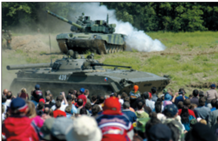
Jak dokazuje snímek z předchozích ročníků, událost je tradičně hojně navštěvovaná. Do Hlučína tak každoročně přiláká stovky turistů ze širokého okolí.

pory, Slezské zemské muzeum Opava a město Hlučín. V pátek 22. května proběhne v době od 10 do 12 hod. veřejný generální nácvik, a to ve stejném rozsahu jako v návštěvní den. Odpoledne se bude na náměstí v Hlučíně konat koncert Posádkové hudby Olomouc a vystoupení mažorettek z Dolního Benešova. (ld)