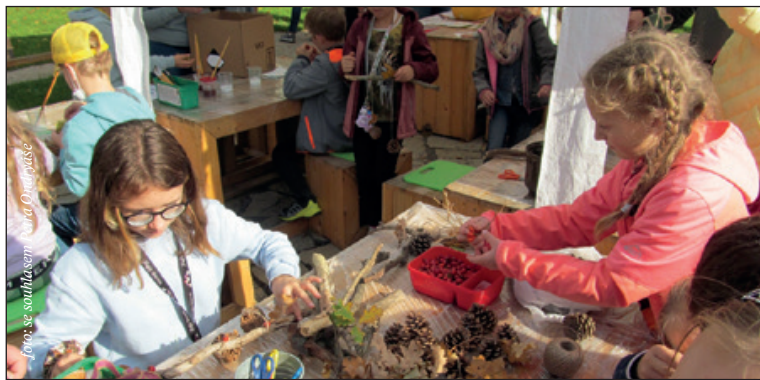
Školní sad ZŠ Tyršova 913 se změnil v zelenou učebnu se 14 edukativními prvky