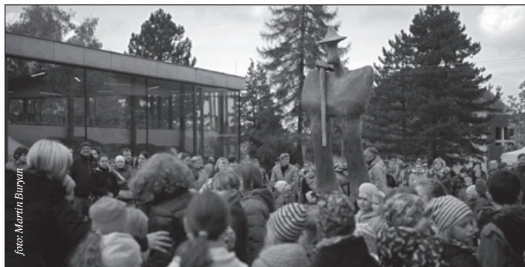
Socha se stala dominantou nové trojanovické návsi. Přišla si ji prohlédnout stovka návštěvníků