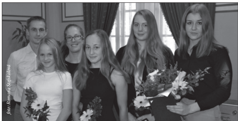
Ocenění převzali také voltážní jezdci z TJ Slovan se svými trenéry