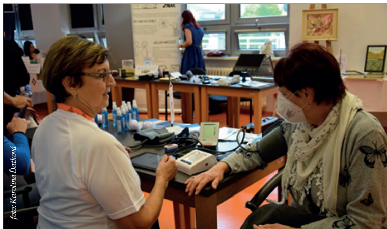
Na Dnu pro pečující a seniory se mohli zájemci seznámit s nabídkou soc. služeb, součástí bylo i měření tlaku