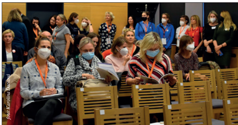
Den pro pečující a seniory nabídl také řadu odborných přednášek