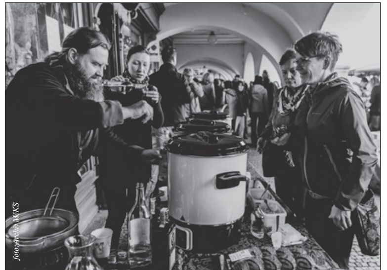
Každý recept na vařonku je jiný, ale který je ten nejlepší? To se dozvíte v pátek 12. 11. Přijďte ochutnat