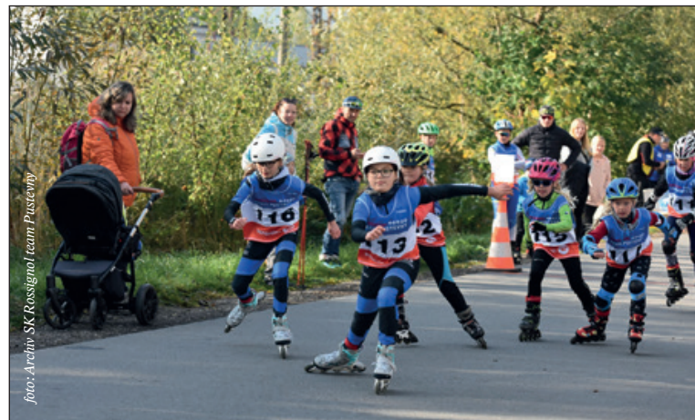
Pro účastníky byly připraveny dvou, čtyř a šestkilometrové tratě