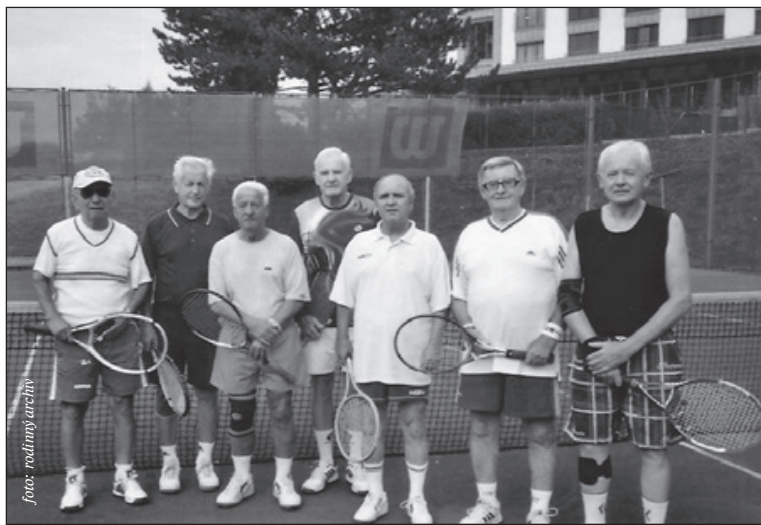
Účastníci Gulášového turnaje, rok 2016