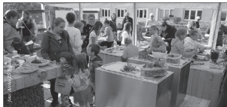
Příchozí se mohli občerstvit ovocem a zeleninou, pro žízňivé byl připraven mátový a meduňkový čaj.