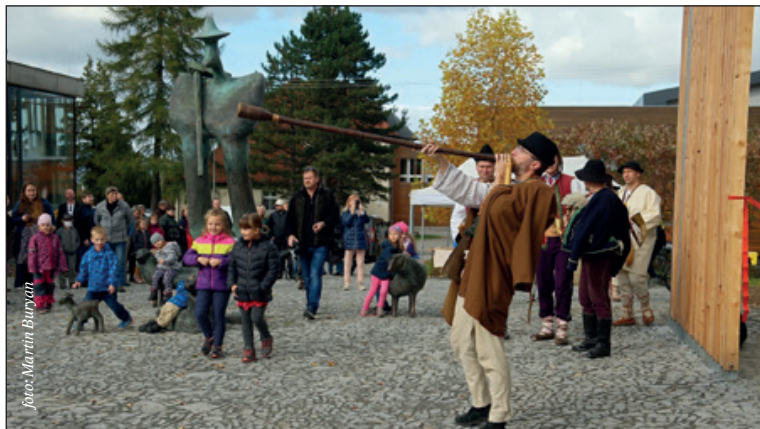
Slavnostní otevření nové návsi v Trojanovicích